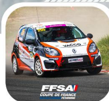
FFSA COUPÉ DE FRANCE